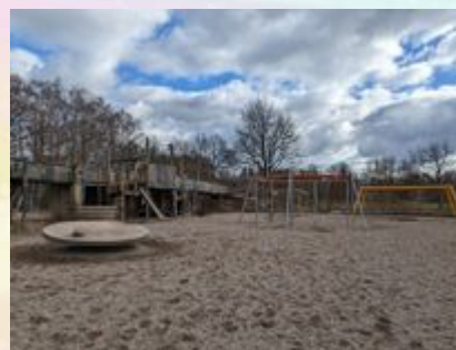
Hier ist ein Bild vom Schemmannspielplatz.

Zu Fuß, mit dem Fahrrad oder mit der U1 bis zum Meiendorferweg oder mit dem 24er Bus bis zur Eulenkrugstraße oder mit dem Auto. Die Zufahrt ist neben dem Haus mit der Nummer 42.