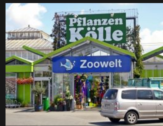
Das ist Pflanzen Kölle!