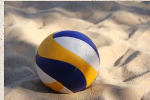
Das ist ein Volleyball.

Tipp Beim Volleyball lernst du den Teamgeist kennen.