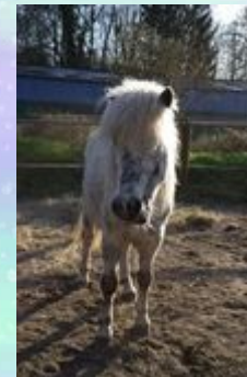
Rübe ist das netteste Pony.