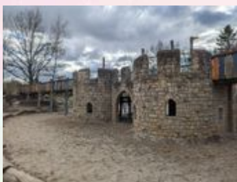
Das ist die coole Burg.

Du kannst dort gut Kindergeburtstage feiern.