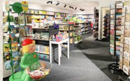
Das ist die Lerche von innen.

Die Lerche ist schön für Kinder, nicht nur weil es dort Spielsachen gibt sondern auch weil du in der Lerche Schulsachen kaufen kannst.