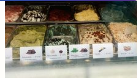
Es gibt über 40 Eissorten.

Angebote für Kinder: Es gibt dort auch witzige Eisbecher! Zum Beispiel gibt es Pinocchio oder auch Gummibärcheneis.