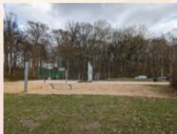
Hier kannst du auch Ballspiele spielen.