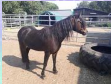
Happy ist sehr verfressen.