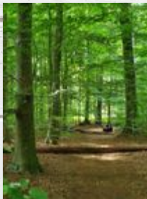
Das ist der Volksdorfer Wald.

In Volksdorf gibt es viele Bäume. Es gibt auch mehrere Seen, wo du aber nicht baden gehen darfst. Mitten in Volksdorf gibt es das Dorf. Hier gibt es viele Geschäfte.