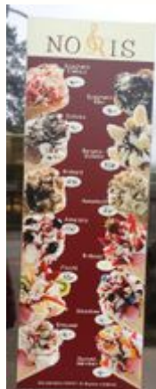
Es gibt großes Eis für Kinder.