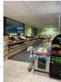
Das ist die Gemüse- und Obsttheke.