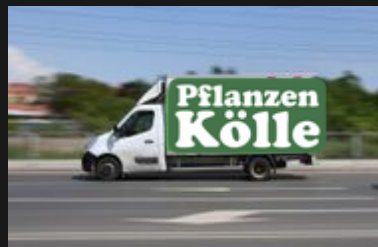
Das ist ein Pflanzen-Kölle-Lastwagen.

In Pflanzen Kölle gibt es auch ein Restaurant. Dort kannst du Schnitzel und Fleischbällchen essen.