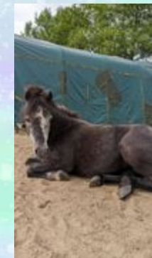
Rubin ist das jüngste Pony.