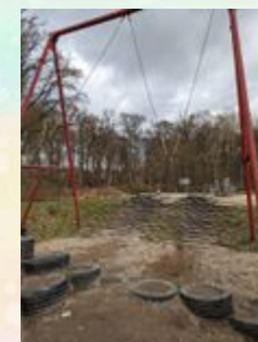
Das ist die große Schaukel.

Adresse: Schemmannstraße 56, 22359 Hamburg